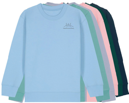
Sweatshirt Rundhals (110-106DFS Mini Changer 2.0)

Stick in Weiß für french navy, glazed green